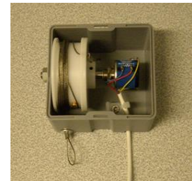
Lugesensor LVL-950 / 937

Den primære funktion i Energy Saver er at sikre, at hejseruden lukker automatisk, når stinkskabet ikke er i anvendelse. Via en personsensor, som er monteret på stinkskabet, registreres, om der er personaktivitet foran stinkskabet. Hvis der ikke har været en person i den indstillede tid (30 sek. til 2 timer) lukker hejselugen i.